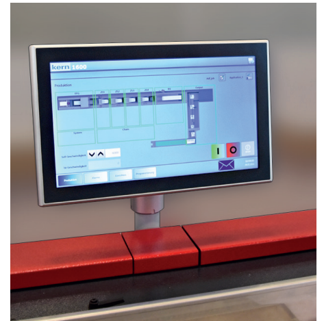
Plate-forme logicielle Sphera

Le système est conçu pour être connecté aux solutions logicielles Kern mailFactory®. La suite logicielle accompagne l'ensemble du processus de traitement dans les domaines suivants : surveillance des documents, contrôle, suivi, mesure, analyse ainsi qu'optimisation de l'ensemble des processus.